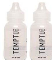
S/B プライマー 1oz