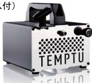
TEMPTU S-ONE コンプレッサー(ブレイドホース標準)