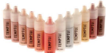
SBファンデーション 1/4oz(約7ml) ブラッシュ&ハイライター 12本セット