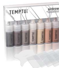
S/Bエアブロー 1/4oz x 7色と ステンシルのセット