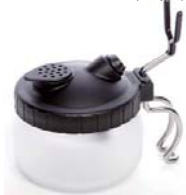
TEMPTU クリーニングポット