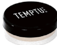
インビジブル ディファレンス パウダー