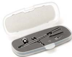
TEMPTU SP-35 ハンドピース