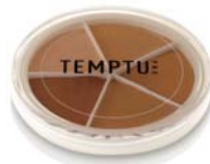
S/Bクリーム コンシーラ ホイール