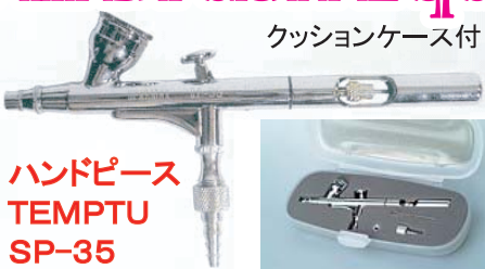
ハンドピース TEMPTU SP-35

メイクアップ、ボディアート用：Sネジ(1/8φ) ノズル：0.35ミリ Wアクション、砂目付 4mlカップ(キャップ付)、プルホール付