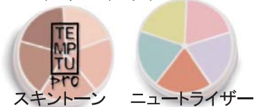
スキントーン ニュートライザー

シリコンの入ったクリームコンシーラ。スキントーン：メイク前のスポット修正ほくろ、あざ消しなどのコンシーラ。男性にはひげあと隠しにもなります。ニュートライザー：肌の色合を修正。