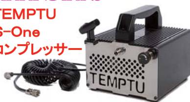
TEMPTU S-One コンプレッサー

本体サイズ：13.5X14.6X9.5センチ、取手4.5センチ(H) 重さ：2.6Kg 最大圧力：50 PSI 風量：7 L/M 消費電力：80W/65W 電圧：AC100V レギュレータ内蔵：調整ダイヤル付 スパイラルホース付(1本) ハンドピースホルダー付