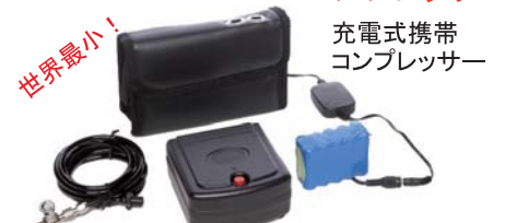
TEMPTU V-One コンプレッサー

本体サイズ：13.5X14.6X9.5センチ、取手4.5センチ(H) 重さ：2.6Kg 最大圧力：50 PSI 風量：7 L/M 消費電力：80W/65W 電圧：AC100V レギュレータ内蔵：調整ダイヤル付 スパイラルホース付(1本) ハンドピースホルダー付